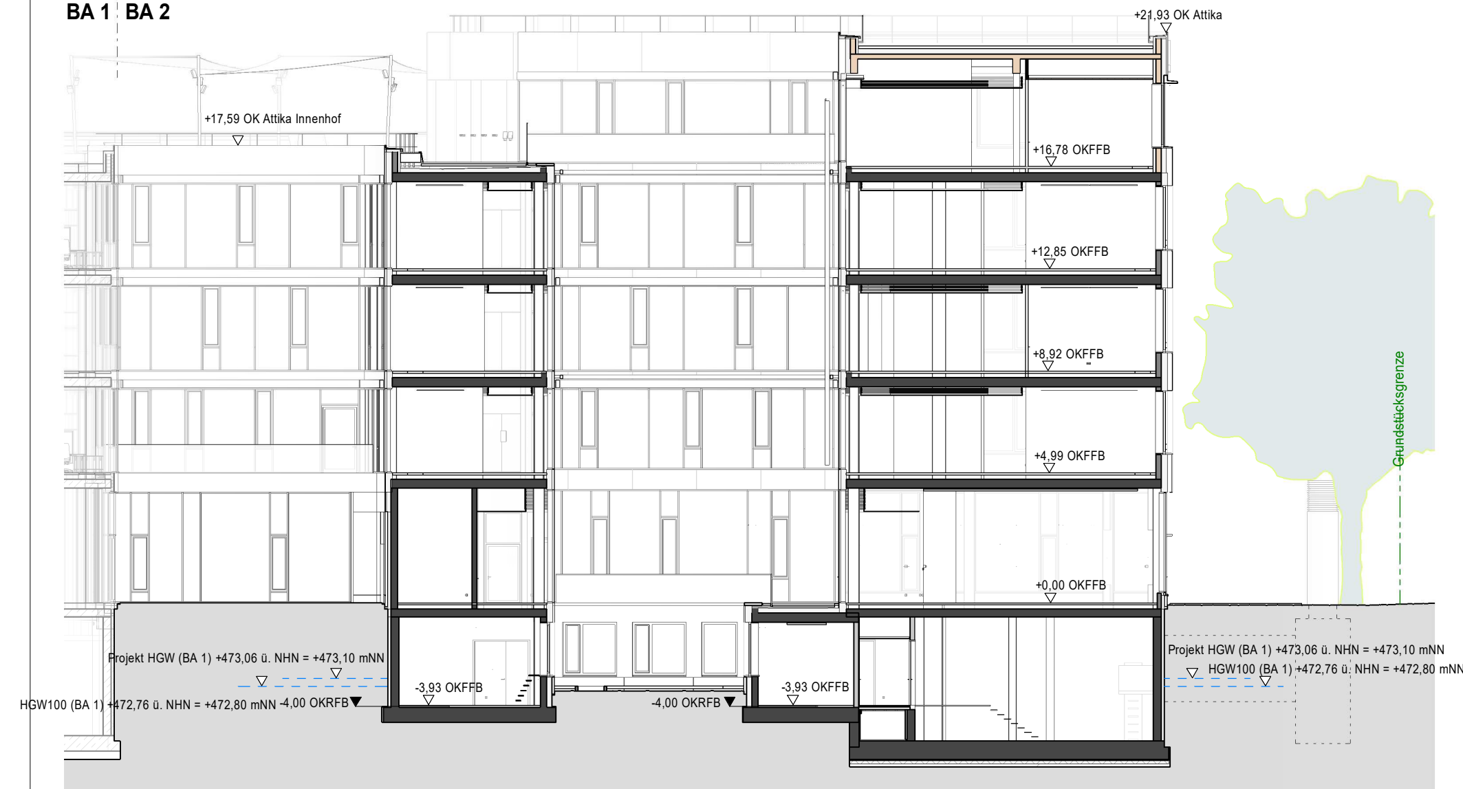
Schnitt C-C Reduziert M 1:200