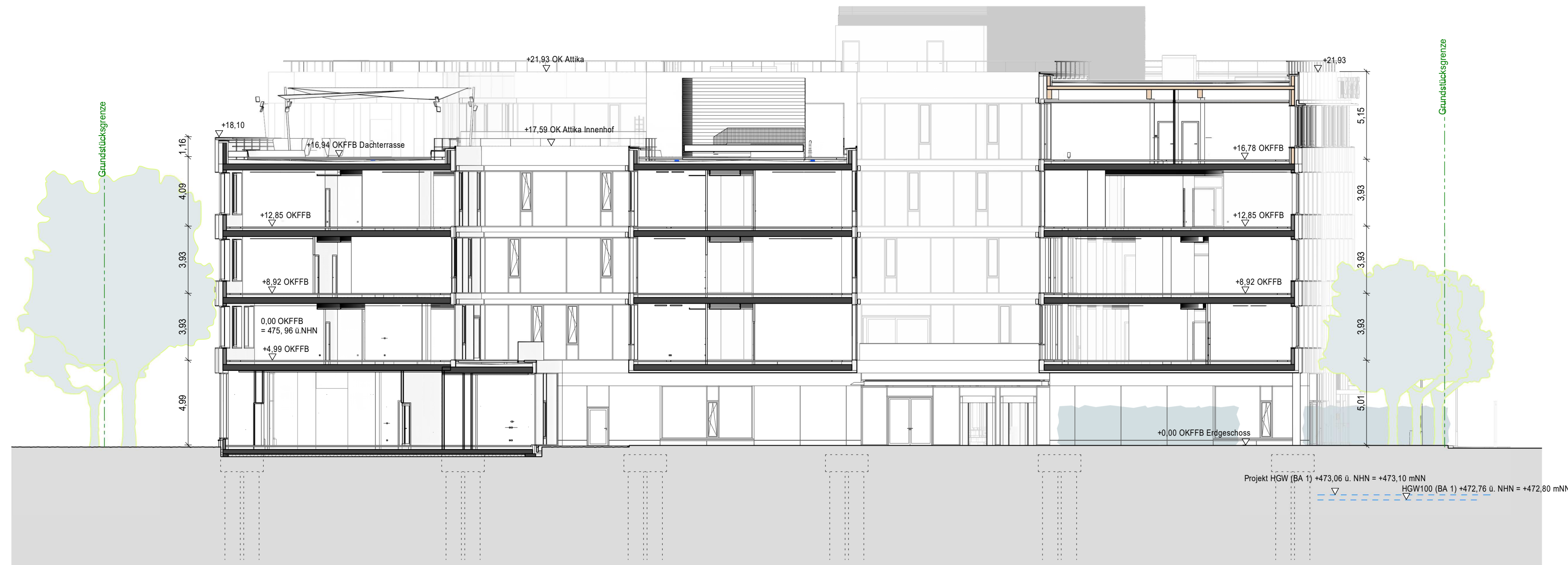
Schnitt A-A Reduziert M 1:200

ALLE HÖHENANGABEN BEZIEHEN SICH AUF ±0,00 = +475,96 NHN (UTM: HÖHENSTATUS 170; LAGESTATUS 489)